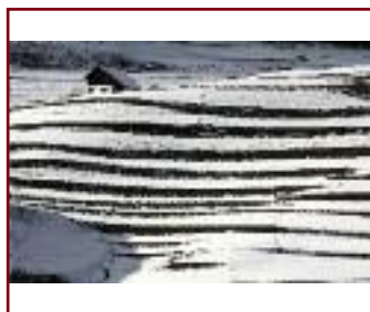
BIANCO E NERO DI /VON PAOLO ORTELLI