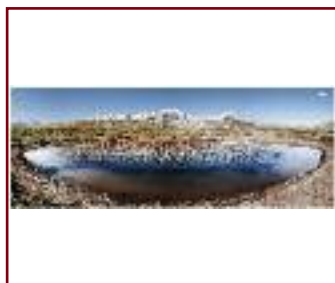
CORNO GRANDE 2 DI /VON PIERGIULIO FIORE