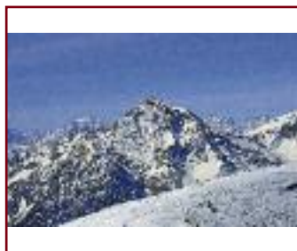
VALSUSA OH CARA DI/VON FRANCO MARCHI