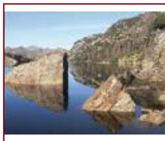
ALLO SPECCHIO DI/VON LUCA BONATI