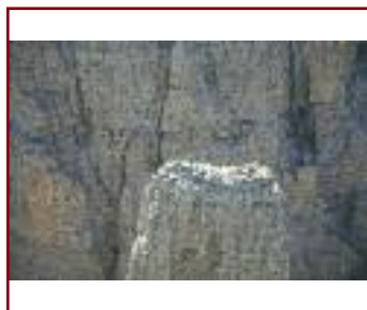
FINALMENTE IN VETTA DI/VON EMILIO BOSCO