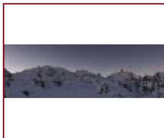
BERNINA SUNRISE DI/VON RALPH KHLOS