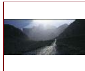
PAMIR MOUNTAINS DI/VON ANDREAS KRAMER