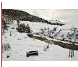
IL RESPIRO DELLA QUIETE DI/VON STEFANO POZZI